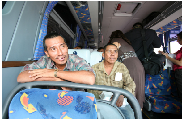
Programa de Repatriación Voluntaria

México sostiene que el fenómeno de la migración debe sustentarse en mecanismos de cooperación que protejan los derechos de la persona y en el reconocimiento de la aportación de su trabajo a la economía receptora. La solución de fondo y de largo plazo a este fenómeno es la mejoría en los niveles de vida y en el empleo para los habitantes de nuestro país. Por ello, la Secretaría de Relaciones Exteriores está decidida a contribuir en la consecución de dicho objetivo por medio de sus objetivos 5 y 12.